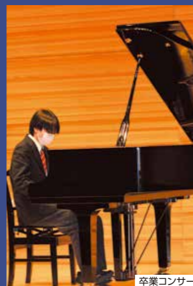
卒業コンサート(保育コース)